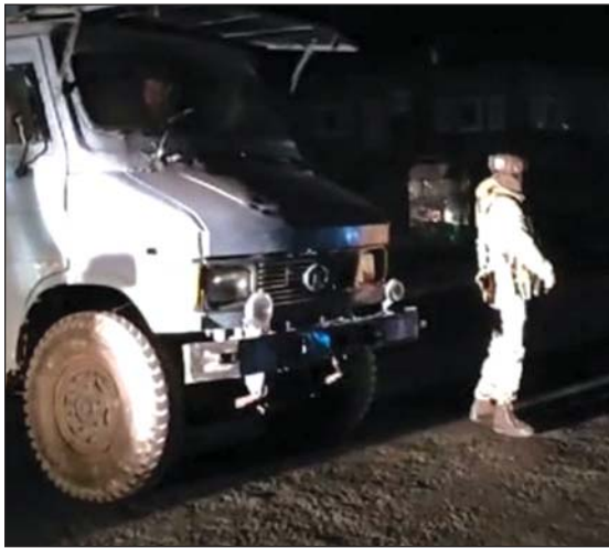
ഗാൻദർബാലിൽ ഭീകരാക്രമണം നടന്നയിടത്ത് നിലയുറപ്പിച്ചിരിക്കുന്ന സുരക്ഷാ ഉദ്യോഗസ്ഥൻ.

ശ്രീനഗർ: ജമ്മു കാശ്മീരിലെ ഗാൻദർബാൽ ജില്ലയിലെ ഗഗൻഗീർ മേഖലയിൽ ഒക്ടോബർ 20-ന് ഉണ്ടായ ഭീകരാക്രമണത്തിനു പിന്നിൽ ഭീകരസംഘടനയായ 'ദ റെസിസ്റ്റൻസ് ഫ്രണ്ടിന്റെ പ്രവർത്തനങ്ങൾ കേന്ദ്രീകരിച്ച് അന്വേഷണം ആരംഭിച്ചു. ഈ വർഷം ജൂണിൽ ജമ്മു കാശ്മീരിലെ റിയാസി ജില്ലയിൽ തീർത്ഥാടകർ സഞ്ചരിച്ചിരുന്ന ബസിന് നേരെയുണ്ടായ ഭീകരാക്രമണത്തിനു പിന്നിലും 'ദ റെസിസ്റ്റൻസ് ഫ്രണ്ട്' ആയിരുന്നു. ഇതിന് പിന്നാലെയാണ് ഒക്ടോബർ 20-ന് കാശ്മീരിനെ ഭീതിയിലാഴ്ത്തിയ മറ്റൊരു ഭീകരാക്രമണവും നടന്നിരിക്കുന്നത്. ജമ്മു കാശ്മീരിലെ ഗാൻദർബാൽ ജില്ലയിലെ ഗഗൻഗീർ മേഖലയിൽ തൊഴിലാളികളുടെ താമസസ്ഥലത്ത് ഭീകരർ നടത്തിയ വെടിവെപ്പിൽ ഒരു ഡോക്ടറും ആറ് തൊഴിലാളികളും കൊല്ലപ്പെട്ടിരുന്നു. മരിച്ച തൊഴിലാളികളിൽ ഇതര സംസ്ഥാനക്കാരും ഉണ്ട്. സോനാമാർഗ്ഗ മേഖലയിൽ ശ്രീനഗർ-ലേ തുരങ്കനിർമ്മാണത്തിന് എത്തിയ തൊഴിലാളികളുടെ താമസസ്ഥലത്താണ് വെടിവെപ്പുണ്ടായത്. ജോലിക്കുശേഷം ഒക്ടോബർ 20-ന് വൈകിട്ട് തൊഴിലാളികളും മറ്റു ജീവനക്കാരും ക്യാമ്പിലേക്കു തിരിച്ചെത്തിയപ്പോഴായിരുന്നു ആക്രമണം. രണ്ട് ഭീകരരാണ് ഇങ്ങോട്ടേക്ക് കടന്നുകയറിയതെന്നു സംശയിക്കുന്നു. (ശേഷം 30-ാം പേജിൽ)