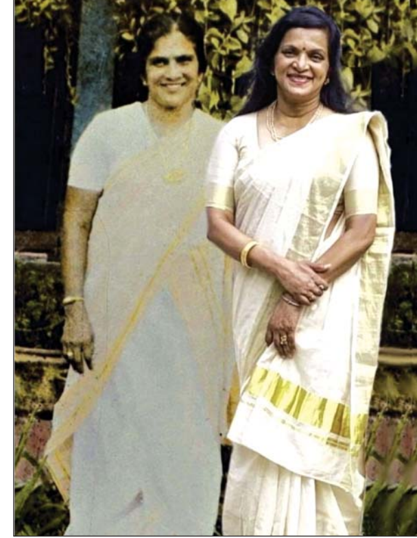
അമ്മച്ചിയോടൊപ്പം ഞാനും (സങ്കല്പ ചിത്രം)

അമ്മച്ചിയുടെ വേർപാടിനു ശേഷം 1971 മാർച്ച് മാസത്തിൽ 'ചെറുപുസ്തകം' മാസികയിൽ പ്രസിദ്ധീകരിച്ചത്