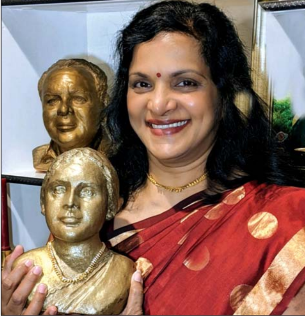
അമ്മച്ചിയെ ഞാൻ സ്കൂൾപുറത്ത് രൂപപ്പെടുത്തി ജീവനേകി എന്നോടൊപ്പം.

തുവരെ സഭയ്ക്കും സമൂഹത്തിനും പാവപ്പെട്ടവർക്കും വേണ്ടി ചെയ്ത എണ്ണമറ്റ സഹായങ്ങളും സേവനങ്ങളും എന്റെ അച്ചായനുപോലും അറിയില്ലായിരുന്നു. ഒരിക്കൽ എന്റെ ഒരു സഹോദരൻ വീട്ടിൽവന്ന് അമ്മച്ചിയോട് ദിക്ഷക്കാരായ ഒരു സ്ത്രീ തെരുവിൽ മരിച്ചുകിടക്കുന്നു എന്ന വിവരം അറിയിച്ചു. അവളുടെ കഴുത്തിൽ ഒരു വെത്തിങ്ങാ ഉണ്ടെന്നും പറഞ്ഞു ('വെത്തിങ്ങ' കത്തോലിക്കർ ധരിക്കുന്നതാണ്). അമ്മച്ചി അവിടെ ചെന്ന് ചുറ്റും ഒരു മറ ഇട്ട്, ആന്റി സെപ്റ്റിക് വൈകാരിക ഉപയോഗിച്ച് അവരെ വൃത്തിയാക്കി. നല്ല വസ്ത്രം ധരിപ്പിച്ചു. ഒരു ശവപ്പെട്ടി വാങ്ങി ഇടവക വികാരിയെ വിളിച്ച് ആ വൃദ്ധയ്ക്ക്