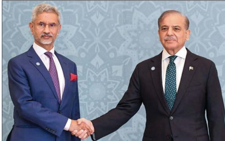
പാക്കിസ്ഥാനിലെ ഇസ്ലാമാബാദിൽ എസ്സിഒ സമ്മേളനത്തിൽ പങ്കെടുക്കാനെത്തിയ വിദേശകാര്യമന്ത്രി എസ്. ജയശങ്കർ പാക് പ്രധാനമന്ത്രി ഷൈബ്ബാസ് ഷെരീഫിനൊപ്പം.

വിദേശകാര്യമന്ത്രി എസ്. ജയശങ്കർ വീണ്ടും ഹസ്തദാനം ചെയ്താണു പാക്കിസ്ഥാൻ പ്രധാനമന്ത്രി സ്വീകരിച്ചത്. ഒക്ടോബർ 15-ന് രാത്രി നടന്ന അന്താരാഷ്ട്ര വിരുത്തിലും ഇരുവരും ഹസ്തദാനം ചെയ്യുകയും സൗഹൃദം പങ്കുവെക്കുകയും ചെയ്തിരുന്നു.