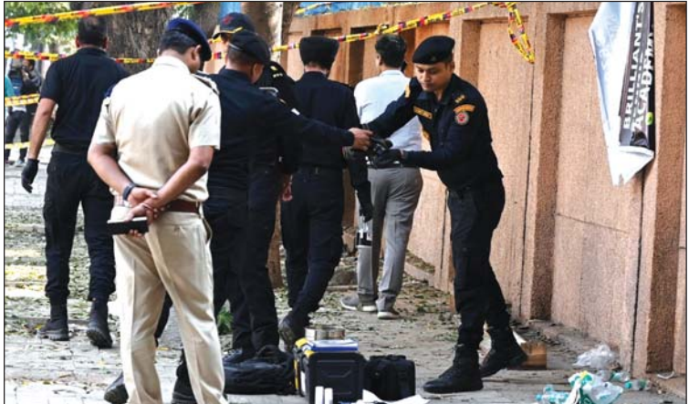
ഡൽഹിയിലെ പ്രശാന്ത് വിഹാറിൽ സിആർപിഎഫ് സ്കൂളിനു സമീപം സഫോടനമുണ്ടായ സ്ഥലം എൻഐഎ ഉദ്യോഗസ്ഥർ പരിശോധിക്കുന്നു.

അധോലോക കാലത്തെ മുൻബൈക്കു സമാനമാണ് ഡൽഹിയെന്നും അതിഷി എക്സിൽ കുറിച്ചു. സംസ്ഥാനത്തെ ക്രമസമാധാന സംവിധാനം തുറന്നുകൊടുക്കണമെന്നും സഫോടനമെന്നും അവർ ആരോപിച്ചു.