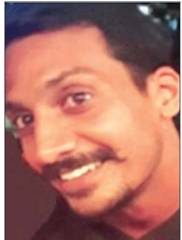
വെസ് യുഎസ് പറയുന്നു.