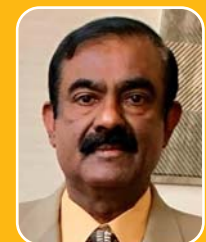
സണ്ണി പുറമറ്റം ചിരൈഗോ