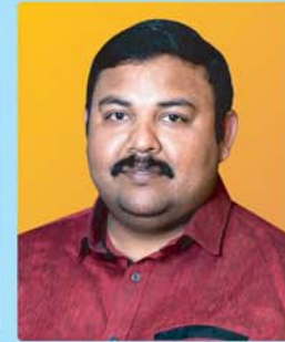
Sijo Pullorkunnel Ward-2