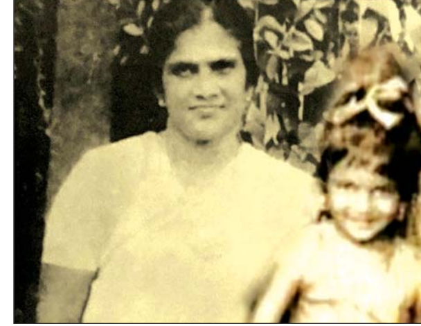
അമ്മച്ചിയുടെ വാത്സല്യം എനിക്ക് എട്ട് വയസ് തികയുമ്പോൾ ഒരു വിതുമ്പൽ ആയപ്പോൾ

അമ്മച്ചിയുടെ ശവസംസ്കാര ചടങ്ങിൽ സ്നേഹത്തിന്റെയും നന്മയുടെയും പ്രവാഹമാണ് കണ്ടത്. ചുറ്റുമുള്ളവരിൽ അമ്മച്ചി ചെലുത്തിയ ആഴത്തിലുള്ള സ്വാധീനത്തിന്റെ തെളിവായിരുന്നു ആയിരക്കണക്കിന് ആളുകളുടെ സാന്നിധ്യം. അമ്മച്ചി അവരുടെ ജീവിതത്തെ സ്പർശിച്ചതിന്റെ അനുഭവസാക്ഷ്യവുമായി, അമ്മച്ചിയുടെ ജ്ഞാന വാക്കുകളിലൂടെയോ പ്രവൃത്തികളിലൂടെയോ അല്ലെങ്കിൽ അവരുടെ ആവശ്യനേരത്ത് അമ്മച്ചിയുടെ സാന്നിധ്യത്തിലൂടെയോ അമ്മച്ചി അവർക്ക് പ്രിയപ്പെട്ടവളായിരുന്നിരിക്കാം. മരണത്തെ ഭയപ്പെടാതെ, ചുറ്റുമുള്ളവരോട് സഹാനുഭൂതിയും, സ്നേഹവും നിറഞ്ഞ ഒരു ഹൃദയമായിരുന്നു എന്റെ അമ്മച്ചിക്ക്. ആരുടെയും പശ്ചാത്തലമോ സഹചര്യമോ പരിഗണിക്കാതെ, സഹായം ആവശ്യമുള്ള ആർക്കും സഹായം നൽകാനും നീട്ടിക്കൊണ്ടും മറ്റുള്ളവർക്ക് സേവനമനുഷ്ഠിച്ചും അമ്മച്ചി ജീവിതം നയിച്ചു. അത് രോഗികൾക്ക് സാന്ത്വനമേകുന്നതോ, ദുഃഖിതർക്ക് പിന്തുണ നൽകുന്നതോ, അല്ലെങ്കിൽ ബുദ്ധിമുട്ടുന്നവർക്ക് കേവലം ഒരു ചെവികൊടുക്കുന്നതോ ആയാലും അവർക്ക് സഹായവും മാർഗനിർദ്ദേശവും നൽകാൻ എ