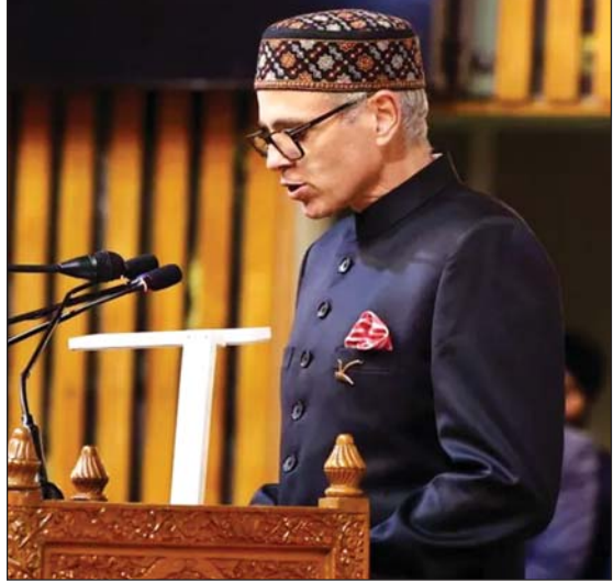
ജമ്മു കാശ്മീർ മുഖ്യമന്ത്രിയായി ഒമർ അബ്ദുള്ള സത്യപ്രതിജ്ഞ ചെയ്ത് അധികാരമേൽക്കുന്നു.

കോൺഗ്രസ് നേതാക്കളായ മല്ലികാർജുൻ ചാർഗെ, രാഹുൽ ഗാന്ധി, പ്രിയങ്ക ഗാന്ധി, എസ് പി അധ്യക്ഷൻ അഖിലേഷ് യാദവ്, ഇടതു നേതാക്കളായ പ്രകാശ് കാരാട്ട്, ഡിരാജ, ഡിഎംകെ നേതാവ് കനിമൊഴി, എൻസിപി നേതാവ് സുപ്രിയ സുലെ, പിഡിഡി അധ്യക്ഷ മെഹ്ബൂബ മുഹ്തി തുടങ്ങിയവർ സത്യപ്രതിജ്ഞാചടങ്ങിനെത്തി. 90 അംഗ നിയമസഭയിൽ നാഷണൽ കോൺഫറൻസിന് 42 പേരുണ്ട്. ഭരണസഖ്യത്തിന് 55 പേരുടെ പിന്തുണയുണ്ട്.