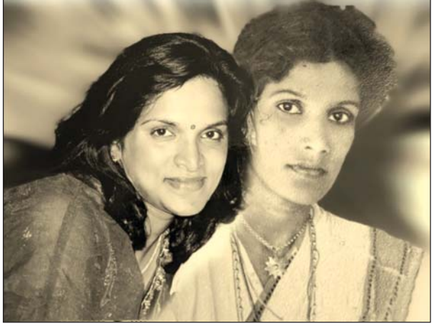
അമ്മച്ചിയോട് എന്റെ മുഖം ചേർത്തുപിടിക്കാൻ കഴിഞ്ഞിരുന്നെങ്കിലോ? (എന്റെ വിഫലശ്രമം)